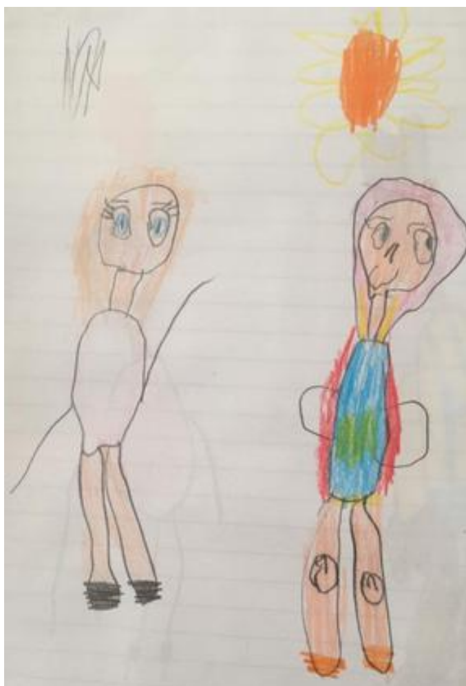
Desenho de uma criança do Centro Municipal de Educação Infantil da Prefeitura Municipal da Serra, 2017.