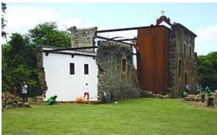
Figura 2 – Ruínas da igreja recentemente restauradas (2020) pela prefeitura da Serra em parceria com outras instituições.