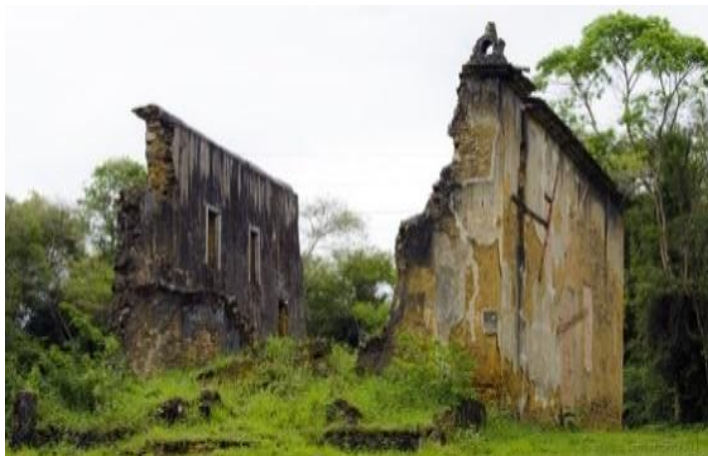
Figura 1 - Ruínas da Igreja de São José no Sítio Histórico de Queimado. O local possui proteção legal pela resolução nº4/1992 e está registrado no Livro do Tombo Histórico sob o nº183 do Conselho Estadual de Cultura.